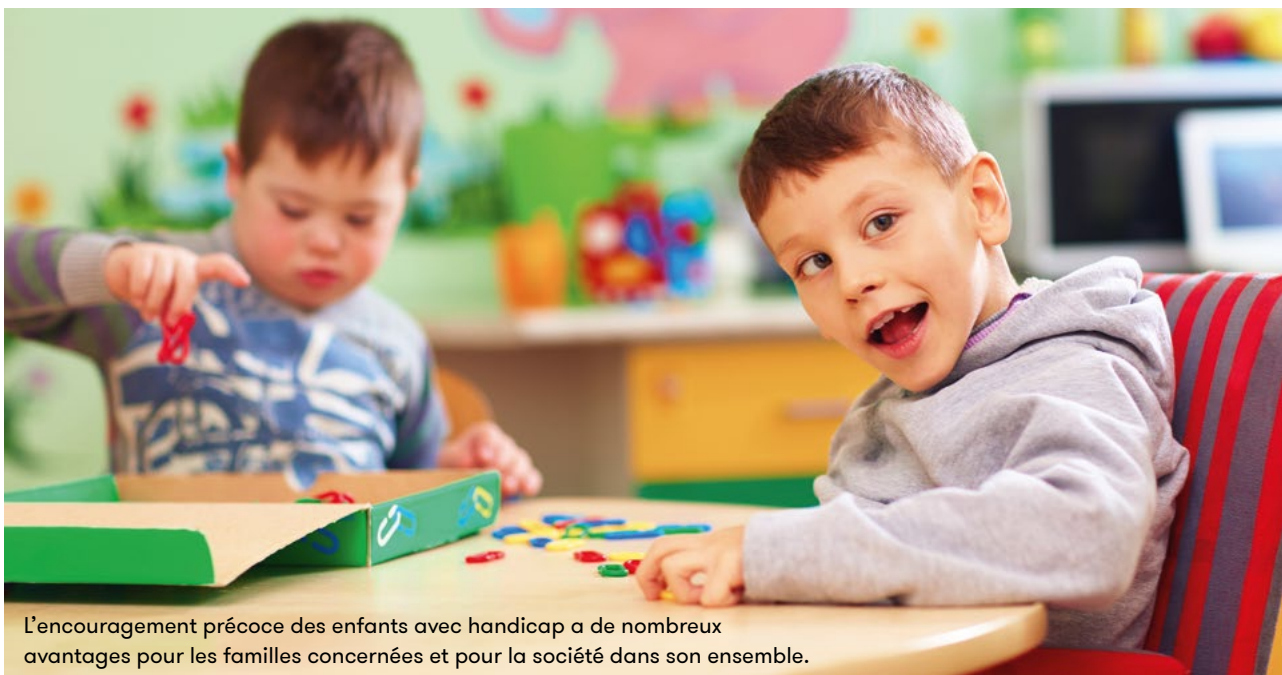
L'encouragement précoce des enfants avec handicap a de nombreux avantages pour les familles concernées et pour la société dans son ensemble.

Texte Anna Pestalozzi Photo Shutterstock Source des cartes Office fédéral de la statistique et Procap