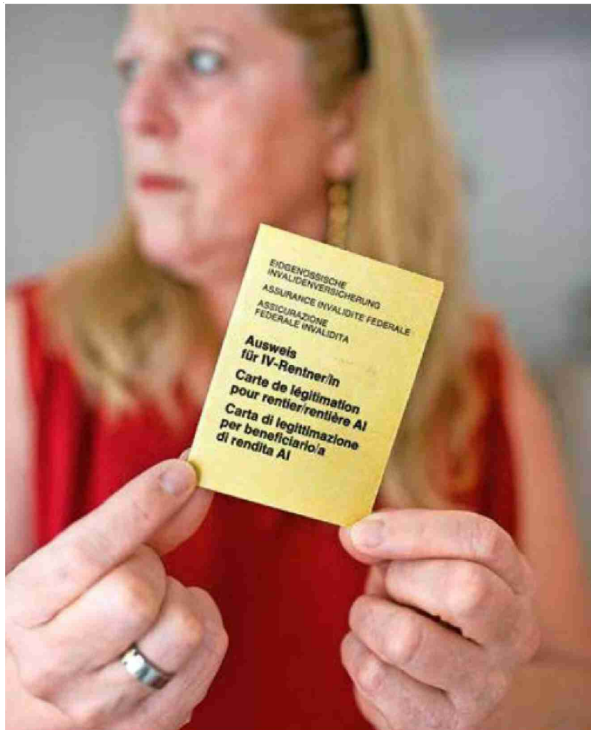
Die Berechnung der IV-Renten sei ungerecht, kritisieren Fachleute und Politiker.